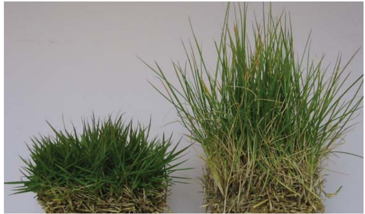
TM9 在来品種 (10月のターフ、年間窒素施肥量7g/m 2 )