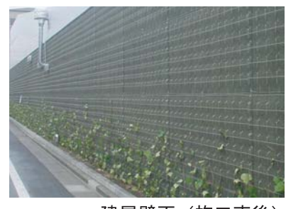
建屋壁面（施工直後）