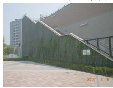
公園施設階段袖壁（施工5ヵ月後）