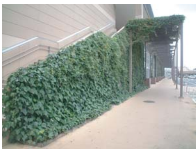
商業施設階段袖壁（施工2年7ヵ月後）