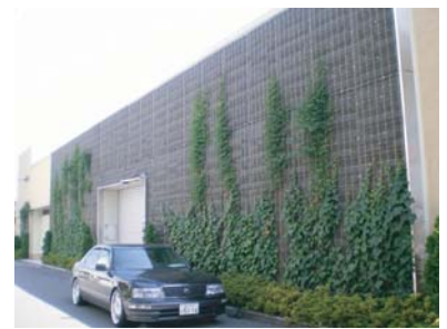
建屋壁面（施工1年3ヵ月後）