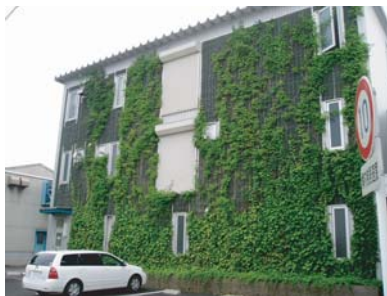
工場壁面（施工3年後）