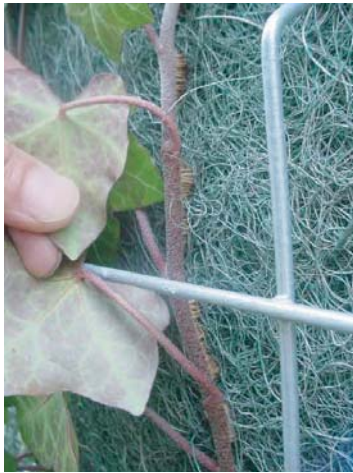
付着根の吸着状況

1m×2mの壁面緑化パネルを直接壁にアンカー固定し、ヘデラなどの植物を登ハンさせる工法。ヤシマットと立体金網を一体化させたことにより、強風や自重による剥離落下を防止し、スピーディで確実な植物の登ハンを実現しました。