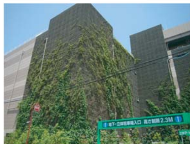
商業施設 立体駐車場の壁面 (2年5ヵ月後)